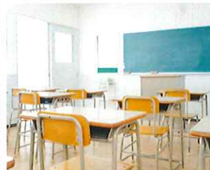
学校・学習塾・幼稚園