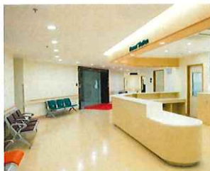
病院・クリニック