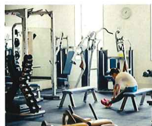
フィットネスジム